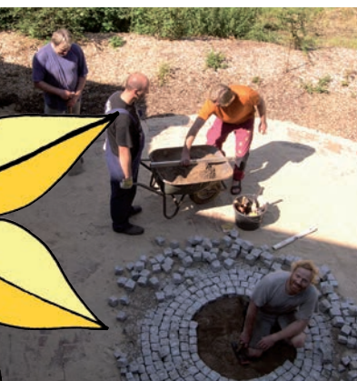
mit Ihrer Hilfe und etwas Geduld...

Die Gartenfreunde Putensen bieten Menschen, die an chronischen psychischen Erkrankungen leiden (gem. §§ 53, 54 SGB XII), ein tagesstrukturierendes Beschäftigungsprogramm an.