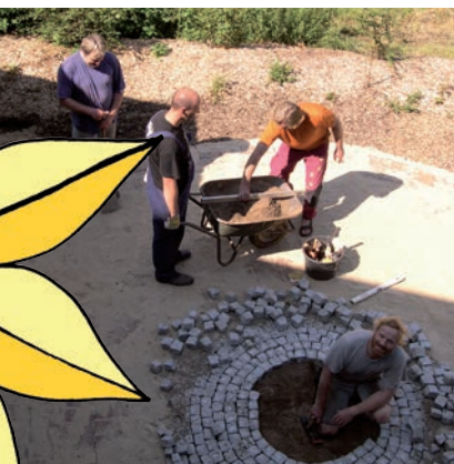
mit Ihrer Hilfe und etwas Geduld...

Die Gartenfreunde Putensen bieten Menschen, die an chronischen psychischen Erkrankungen leiden (gem. §§ 53, 54 SGB XII), ein tagesstrukturierendes Beschäftigungsprogramm an.